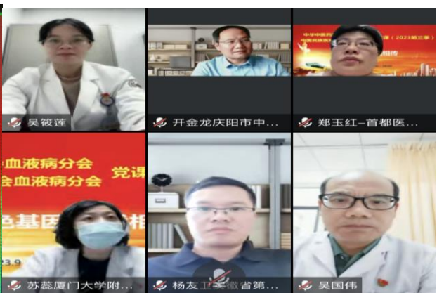
图 12. 参加血液病分会党课学习党员