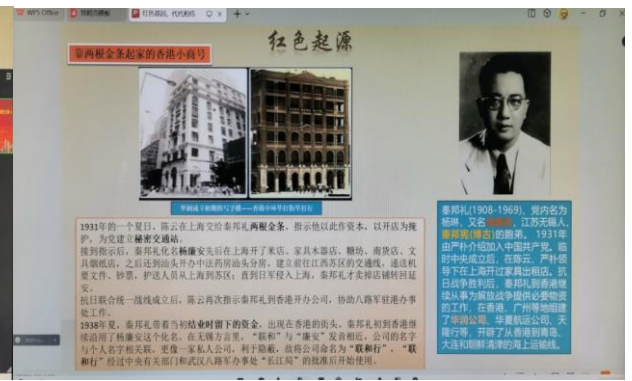
图 6. 血液病分会党课课件图片之二