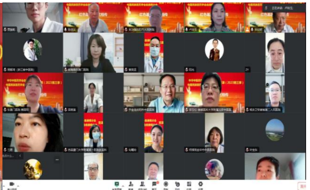
图 4. 血液病分会听课党员与积极分子截图