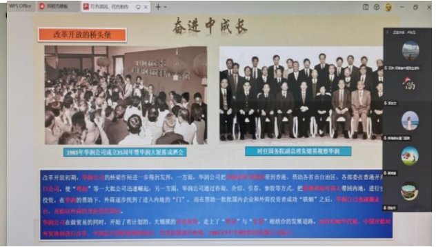
图 10. 血液病分会党课课件图片之六