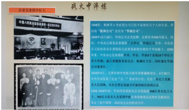
图 9. 血液病分会党课课件图片之五