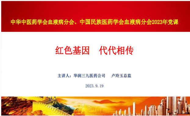
图 1. 2023 年第三季度血液病分会党课题目