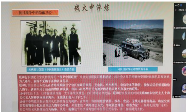
图 7. 血液病分会党课课件图片之三