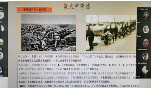
图 8. 血液病分会党课课件图片之四